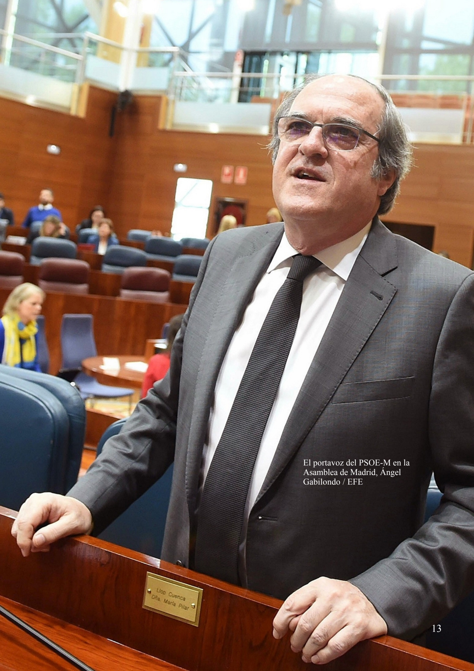
El portavoz del PSOE-M en la Asamblea de Madrid, Ángel Gabilondo