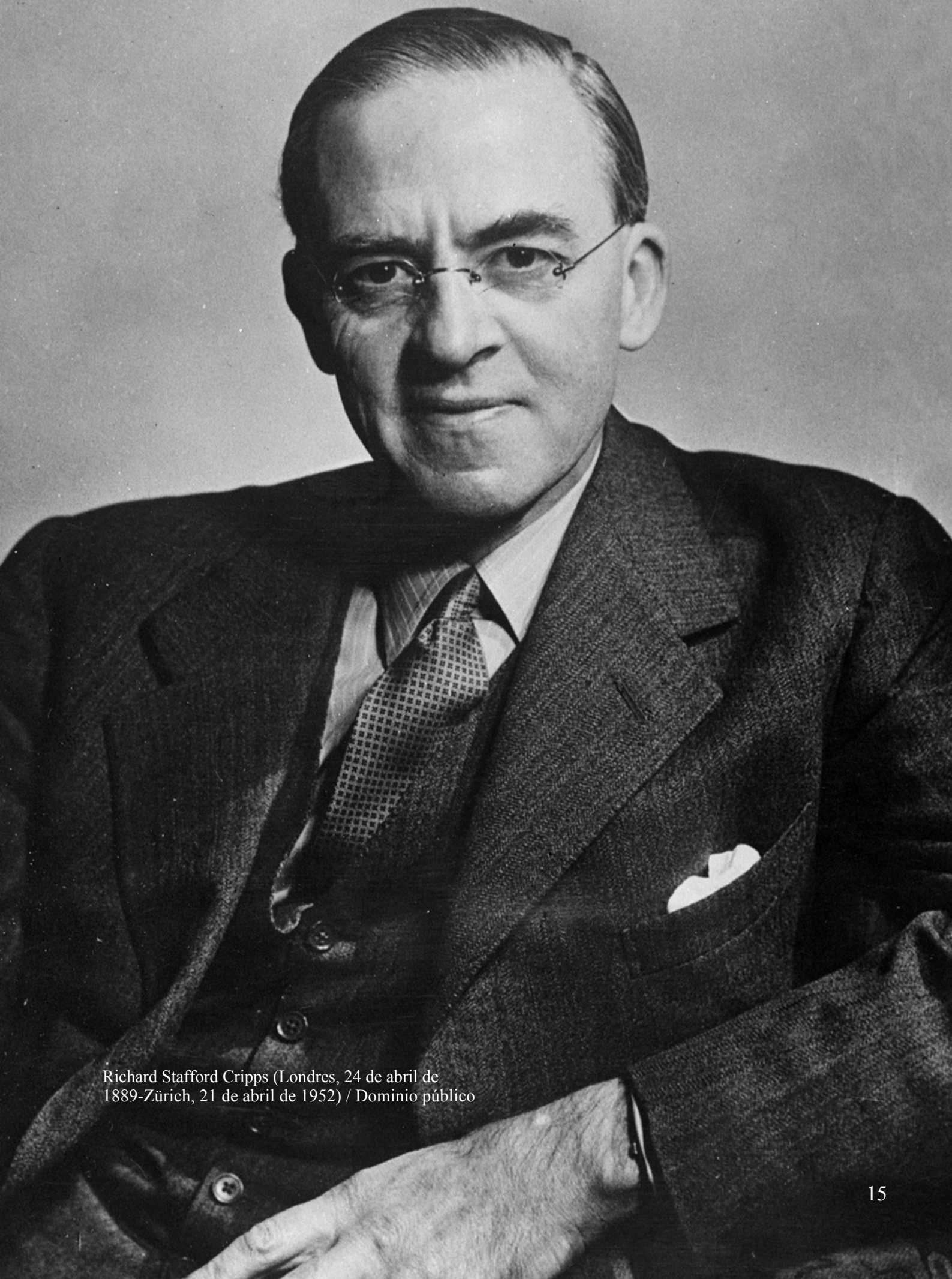
Richard Stafford Cripps (Londres, 24 de abril de 1889-Zürich, 21 de abril de 1952)