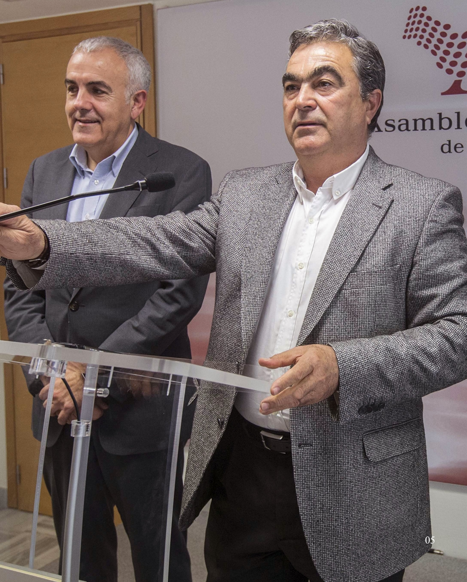
Los diputados Jesús Navarro (d) y Alfonso Martínez Baños, en una imagen de archivo