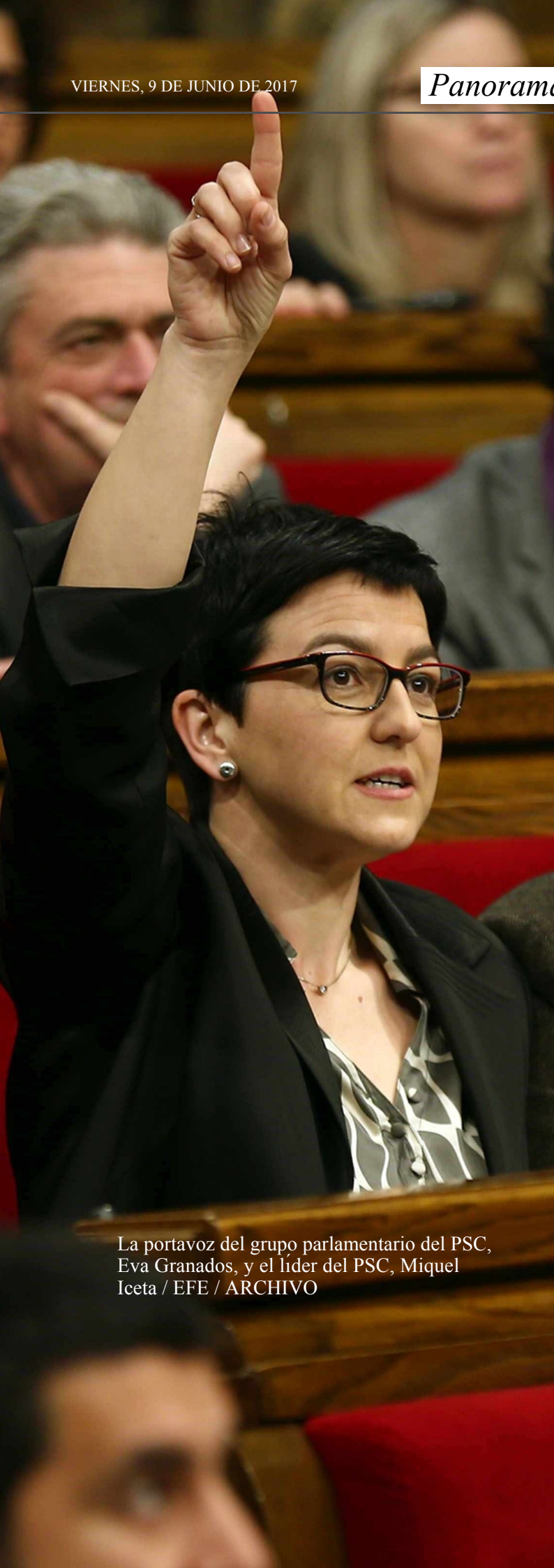
La portavoz del grupo parlamentario del PSC, Eva Granados, y el líder del PSC, Miquel Iceta

por un mecanismo de extraordinaria urgencia, (...) que minimice los riesgos de ser impugnada ante cualquier instancia".