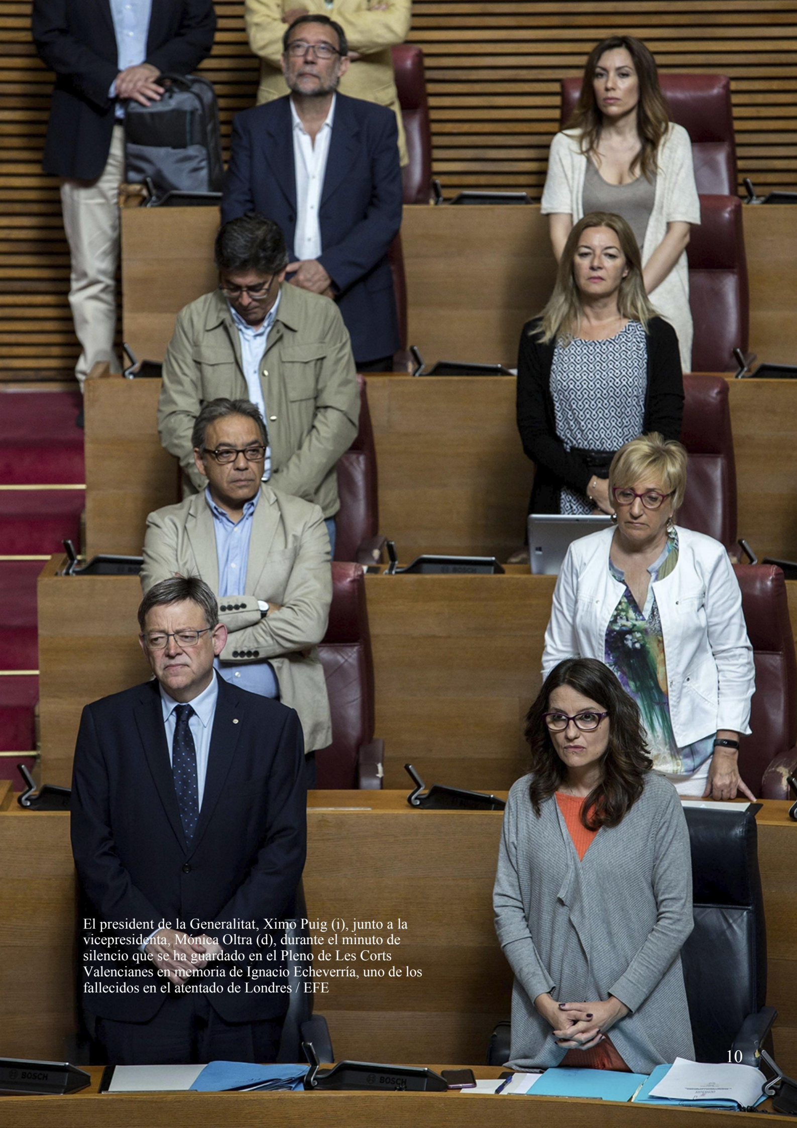
El president de la Generalitat, Ximo Puig (i), junto a la vicepresidenta, Mónica Oltra (d), durante el minuto de silencio que se ha guardado en el Pleno de Les Corts Valencianes en memoria de Ignacio Echeverría, uno de los fallecidos en el atentado de Londres